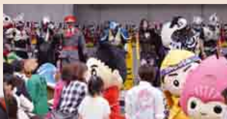
県内のゆるキャラも14体イベントに駆けつけ、会場は大盛り上がり

10月11日、昴の郷多目的広場で、奈良の悪キャラ「ブラックス將軍」を始め、全国から悪キャラが集まった『全国悪キャラサミット・in・十津川』が開かれました。 全国から集まった悪キャラとヒーロー22体による迫力ある舞台に来場者約300人が魅了されました。