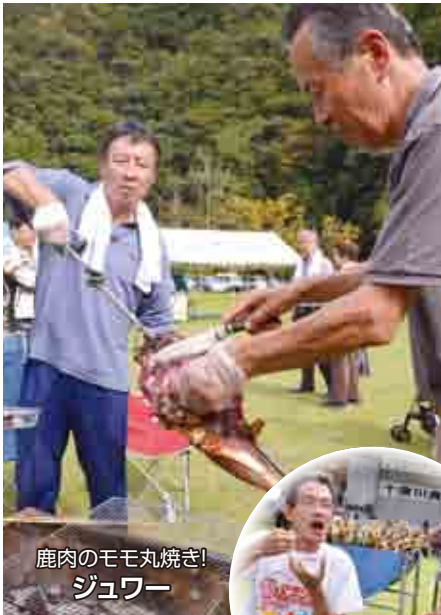
鹿肉のモモ丸焼き! ジュワー