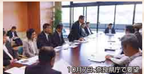
10月7日、奈良県庁で要望