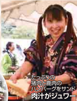
たっぷりの 猪肉と鹿肉の ハンバーグをサンド 肉汁がジュワー