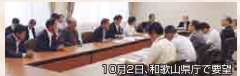
10月2日、和歌山県庁で要望

10月2日と7日、十津川村と田辺市で構成する国道425号(十津川〜龍神間)整備促進協議会が、奈良県と和歌山県に国道425号整備促進の要望を行いました。 国道425号は、継続して道路整備が進められていますが、まだまだ未改良箇所が残っています。沿線の方々にとって唯一の生活の道であるため、国道425号の計画的な整備が今後も求められます。