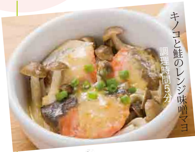
キノコと鮭のレンジ味噌マヨ 調理時間5分